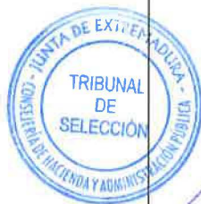
Fdo.: Rocio Segador Silva